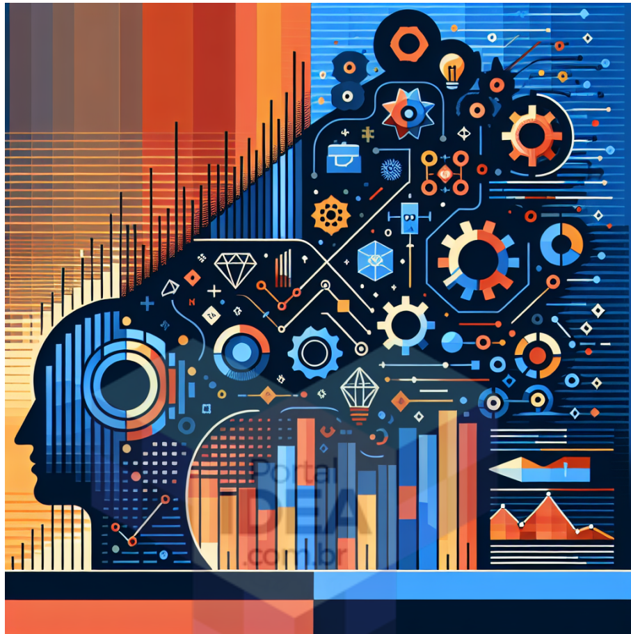
Figura 2 - Os Impactos do ERP no Mundo Empresarial