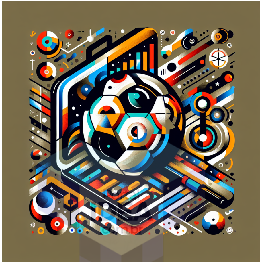
Figura 2 - A Expansão Global do Futebol