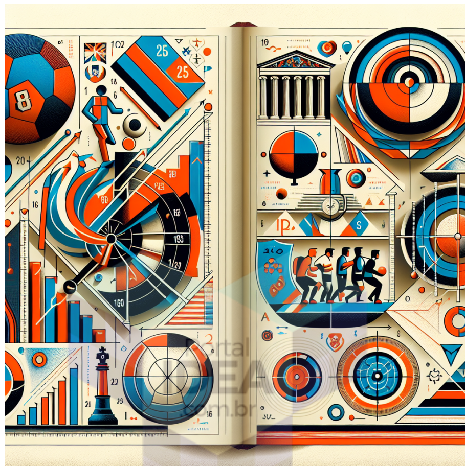
Figura 1 - Origens e Evolução do Futebol